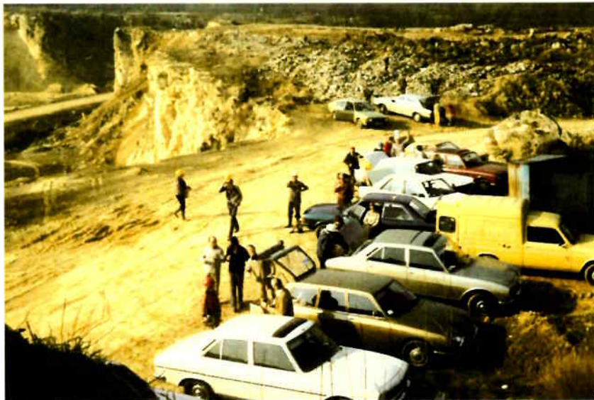
Zuid Limburg, groeve Nckami 22 maart 1980