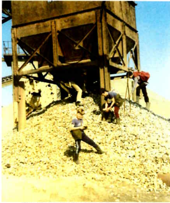
Excursie naar de Berendonk in Wijchen, mei 1982