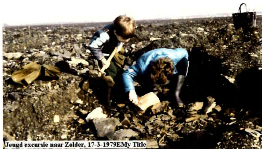
Jeugd excursie naar Zolder, 17-3-1979 EMy Title