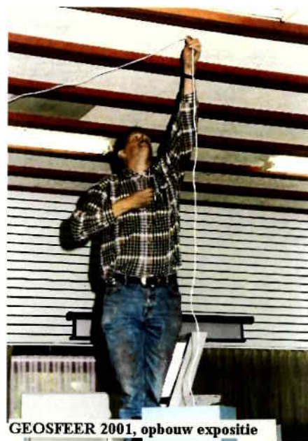
GEOSFEER 2001, opbouw expositie