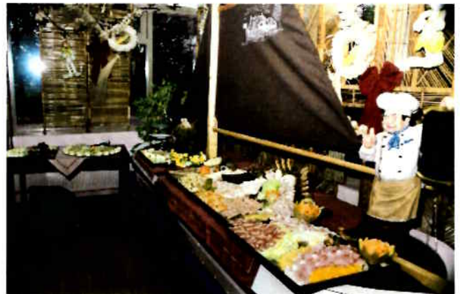
en tot slot het buffet