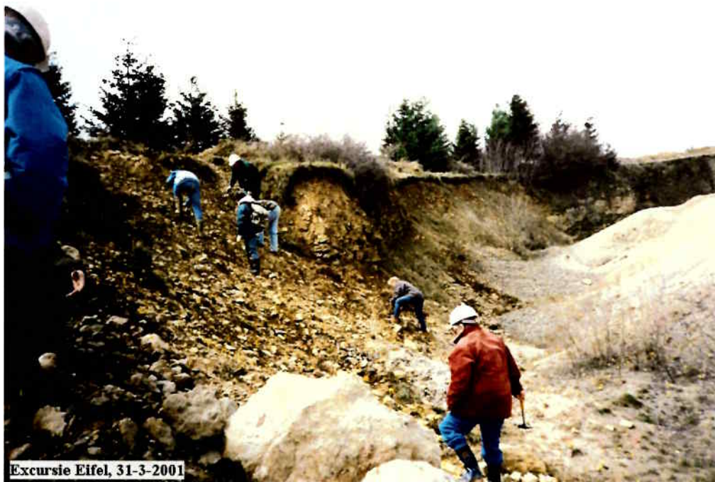
Excursie Eifel, 31-3-2001