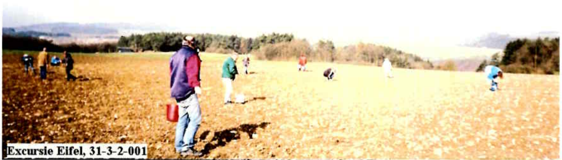
Excursie Eifel, 31-3-2-001