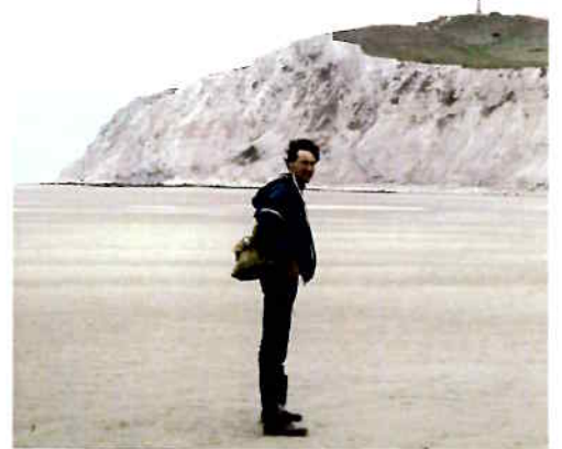
Excursie naar Boulogne, 1988