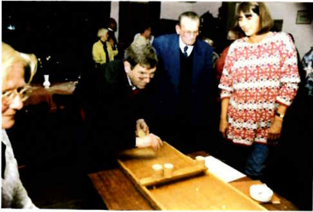
oud hollandse spelletjes zoals sjoelen