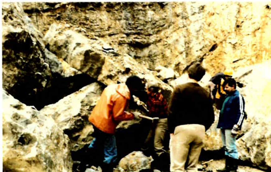
Excursie naar Montignies-le-Tilleul bij Charleroi, 29-3-1981