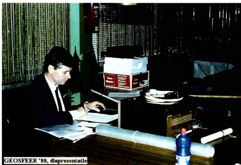
GEOSFEER '88, diapresentatie