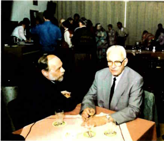
En wat is jouw score?