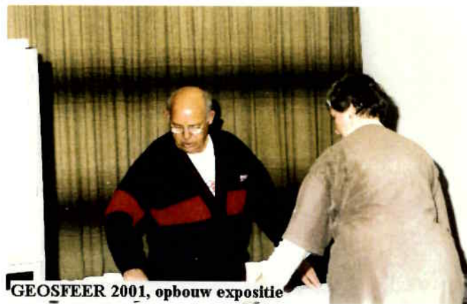
GEOSFEER 2001, opbouw expositie