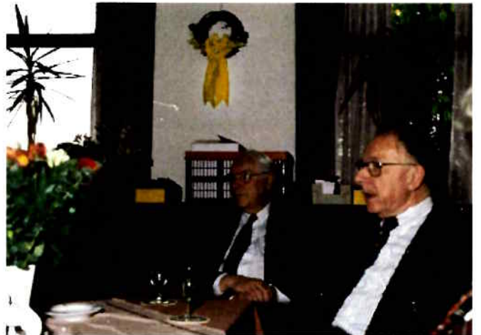
En jouw score?