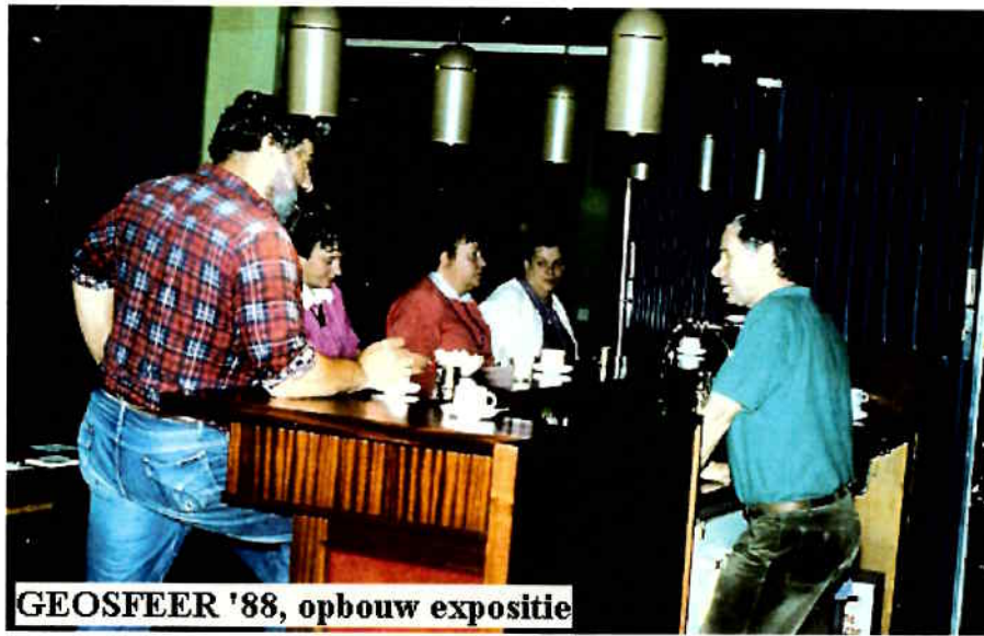
GEOSFEER '88, opbouw expositie