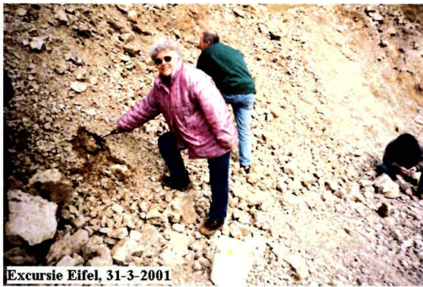
Excursie Eifel, 31-3-2001