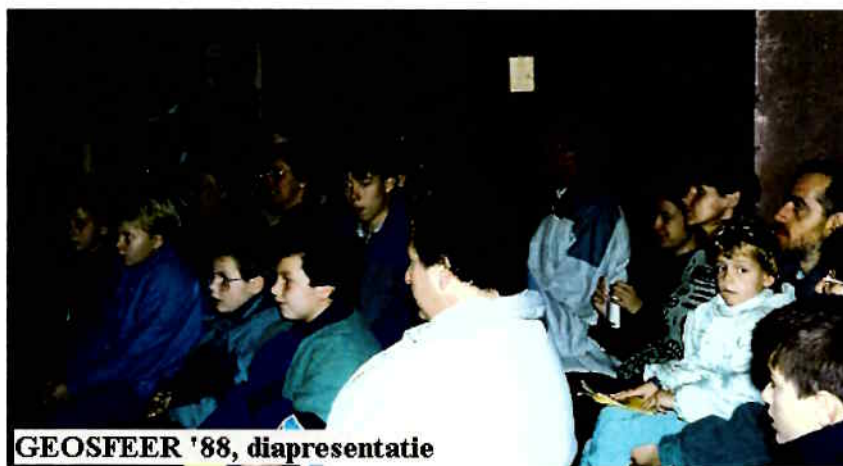
GEOSFEER '88, diapresentatie